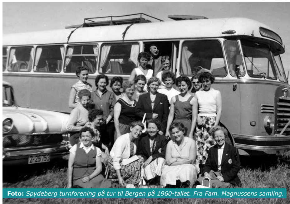
Foto: Spydeberg turnforening på tur til Bergen på 1960-tallet.