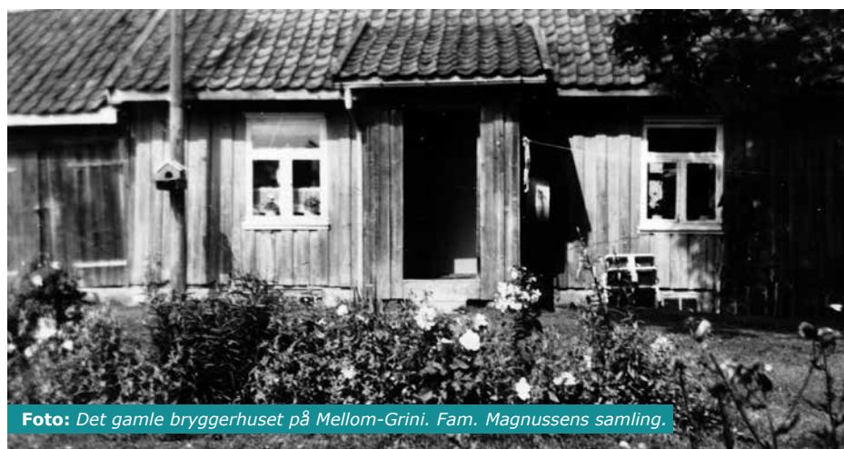
Foto: Det gamle bryggerhuset på Mellom-Grini.